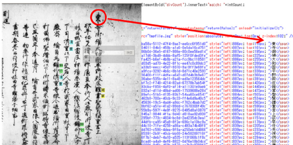
図3 Javascript による検索・ハイライト表示機能をもつ html ファイル