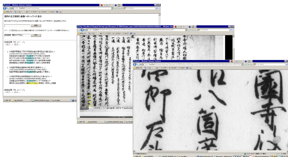
図4 Web上での検索画面・検索結果のハイライト表示・タイル状画像による詳細表示

なお、データベースに登録されているデータの更新などの作業はデータベースを直接に操作するのではなく、(1)文字データ埋め込み画像ファイルを更新、(2)更新後の画像ファイルを再度インポートする、という手順でおこなう。これは、データベースやサーバ上の画像は公開のための派生データと位置づけ、データの管理はあくまで文字データを埋め込んだ画像ファイルを基礎とするためである。