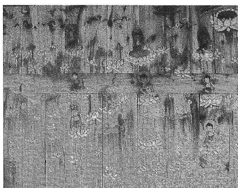
図3 普光寺大雄寶殿背面の蓮華化生図

たとえば、やはり2009年8月に見つけたなかには、京畿道坡州市広灘面霊場里普光寺大雄寶殿背面の蓮華化生図（図3）がある。木版に直接描いたこの絵は、上端の瓦屋の彩色が剥がれて鮮明ではないものの、極楽浄土であることは、画面ぎっしりの白蓮や化生する死者たちから推し測ることができよう。