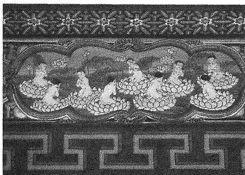
図4 靈覚寺無量寿殿扁額真下の蓮華化生図

うか、つまり見逃しやすいほどだ。韓国の寺はいわゆる仏国土の蓮華蔵そのものを所狭しに絵画やレリーフで具現しているからこそ、浄土往生を表現した蓮華化生図は仏教的論理からみても一つの到達点といえよう。