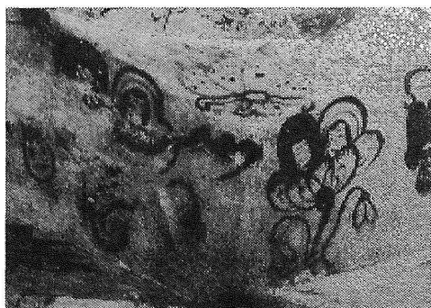
図2 高句麗長川一号墳の夫婦蓮華化生図

承文化である可能性を示唆する壁画がある。それは高句麗古墳壁画であって、中国吉林省集安市の長川一号墳（5世紀中期）前室天井でみつかった夫婦蓮華化生図である。