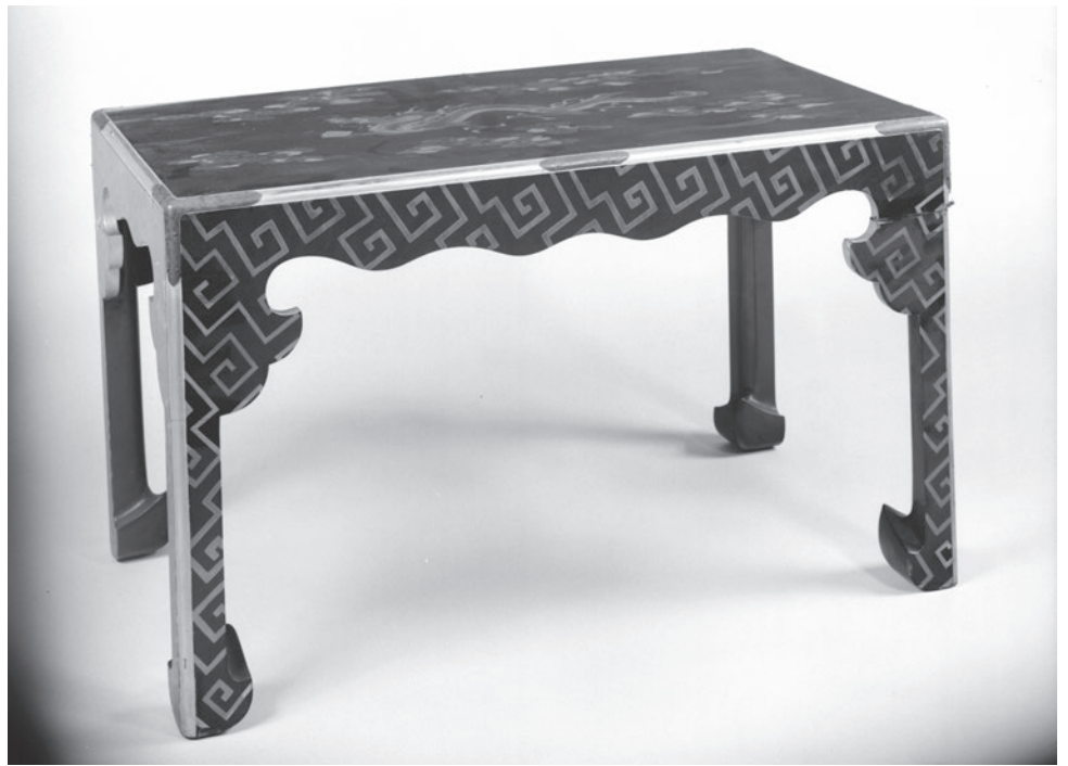
雲龍時絵尊案 東京国立博物館所蔵

本学には、明治4年(1871)に閉鎖された江戸幕府の教学機関であった昌平坂学問所の所藏品や湯島聖堂所縁の品々が所蔵されています。その中には、湯島聖堂で催された孔子を祀る祭典「積奠」で用いられた美術資料が含まれています。本展では、「積奠」をキーワードに、本学が所蔵する歴聖大儒像6幅をはじめ、東京国立博物館からも孔子像や積奠器などの関連資料を借用し併せて展示いたします。