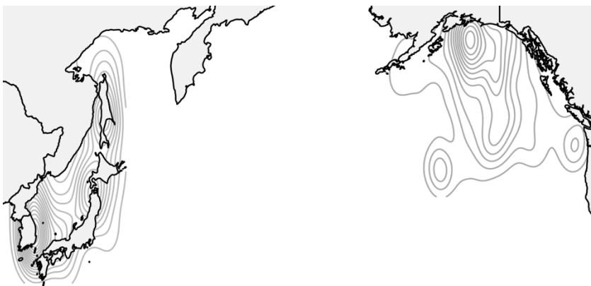
図 3. 天売島及びミドルトン島のウトウの利用海域

天売島とミドルトン島で回収したジオロケータのデータ解析を行い、越冬期の利用海域を特定した (両個体群の利用海域：図 3)。天売島個体群では日本海を南北に利用していたのに対し、ミドルトン島個体群ではアラスカ湾を広く利用していた。越冬期の水銀取り込みを反映すると予測される羽試料を分析し、検証した結果、大気中の水銀濃度と羽中の水銀濃度は両調査地とも相関していることがわかった。これによって、ウトウの体組織が利用海域での汚染物質の取り込みを反映していることが示された。一方で、環境中への水銀排出量が高い海域を利用している天売島個体群と低い海域を利用しているミドルトン島個体群において、体組織中の水銀濃度に大きな差はみられず、大気循環や海流による自然由来の輸送によって水銀が長距離移動し、ウトウ体内の水銀濃度に影響していることが示された。このように、環境中に放出される自然及び人為由来による様々な形態の水銀は、国をまたいで長距離輸送されることから、国際的な環境問題解決に向けて今後のデータ拡充が必要であると考えられる。