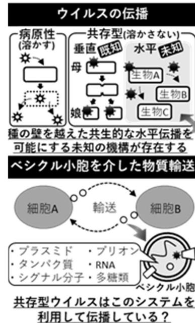
図 1 : 本研究の背景

(4) 共存型ウイルスはどのように水平伝播しているのか? 本研究では宿主にダメージを与えずに広く生物間を移動可能であるということから“細胞外ベシクル小胞”が関わっているのではないかと予想した。細胞外ベシクル小胞はほとんどの細胞で分泌される直径 50~150nm 程度の膜小胞で、離れた細胞間の情報伝達に重要な役割を担う(図 1 下段)。共存型ウイルスと類似した性質を持つプラスミドが細胞外ベシクル小胞を介して伝播すること、DNA ウイルス由来の RNA が細胞外ベシクル小胞中に濃縮される現象はこの仮説を支持している。