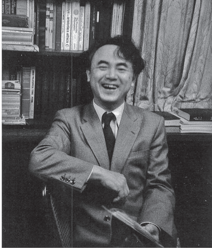
珍しい大笑いの写真 1989