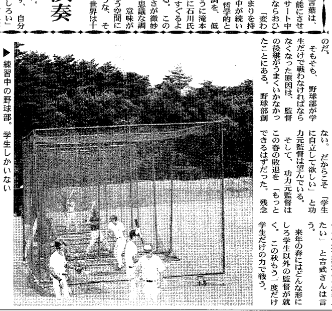
練習中の野球部、学生らしい

インターネット設備の付いたマンションは、学生や教職員にとって非常に便利である。そのため、インターネット設備の付いたマンションは、入居者獲得を期待されている。筑波大学付近のマンション市場は、インターネット設備の付いたマンションが人気を集めている。これは、学生や教職員がインターネットを利用する必要があるためである。インターネット設備の付いたマンションは、学生や教職員にとって非常に便利である。そのため、インターネット設備の付いたマンションは、入居者獲得を期待されている。筑波大学付近のマンション市場は、インターネット設備の付いたマンションが人気を集めている。これは、学生や教職員がインターネットを利用する必要があるためである。