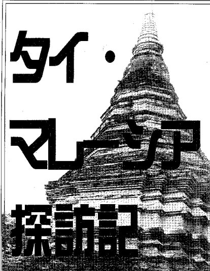
タイ・マレーシア探訪記