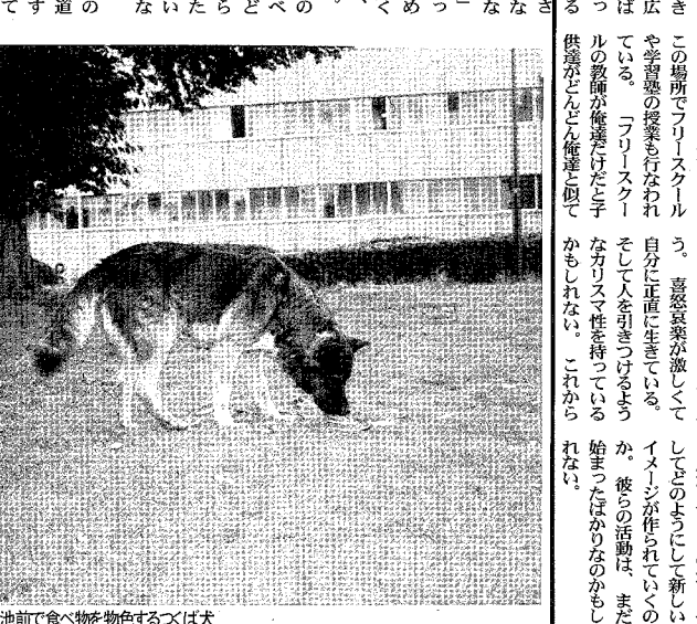
▲松見池前で食べ物物色するつくば犬