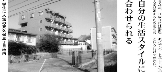
新築の急増。既存物件は家賃低下。築波大周辺の不動産市場は、新築物件の増加により、既存物件の家賃が低下している。

④受験生への 応援メッセージ 筑波大で学んで、社会で活躍してほしい。応援している。