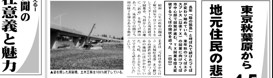
▲空を現した高架橋。土木工事は100%終了している。