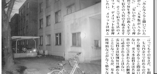
学生宿舎の暮らしかい。写真は、つくば市にある学生宿舎の一角。広々とした居室と、共用施設が充実している。

「みんなが揃って」という理由から、大人数が入居するから、安いからと、同僚や友人、カネ水田は、学生生活の多くを過ごす。宿舎は、大人数が入居するから、安いからと、同僚や友人、カネ水田は、学生生活の多くを過ごす。宿舎は、大人数が入居するから、安いからと、同僚や友人、カネ水田は、学生生活の多くを過ごす。