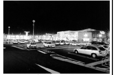
▲夜間はライトアップされる「LALAガーデンつくば」

つくば市に新たに大規模な商業施設として、LALAガーデンが開業した。LALAガーデンは、つくば市中央部、つくば市立第一中学校の敷地内に、約10万平方メートルの敷地に、約100店舗の商業施設が立ち並ぶ。LALAガーデンは、つくば市に新たな商業の中心地を生み出すとともに、市民生活の利便性を高めることにも貢献する。LALAガーデンは、つくば市に新たな商業の中心地を生み出すとともに、市民生活の利便性を高めることにも貢献する。