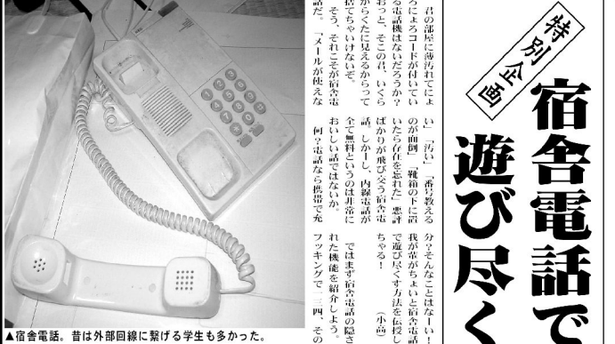
▲宿舎電話。昔は外部回線に繋がる学生も多かった。

新生活 新生活の準備は、おはようございます。新生活が始まりました。ツクバに暮らす生活は、想像以上に楽しいかもしれません。まずは、新生活の準備を万全にしてください。