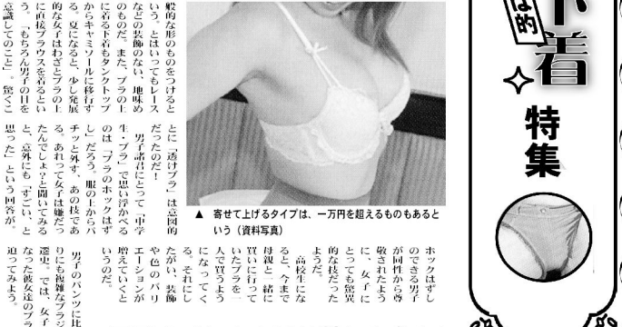
▲ 寄せて上げるタイプは、一万円を超えるものもあるという (資料写真)

女の子のファッション 女子学生は、おしゃれに目覚める時期が、中学生から高校生にかけてと、最も多いことが分かった。また、地元で服を買う人が最も多く、東京や雑誌からも服を買う学生が多いことが分かった。 また、自分の感性を基準に服を選ぶ学生が最も多く、雑誌や友人の意見も参考にしている学生も少なくない。また、有名ブランドの服を選ぶ学生も、全体の3%に達している。