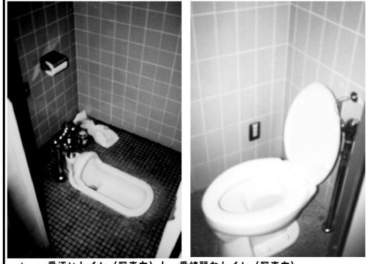
▲一番汚いトイレ(写真左)と一番綺麗なトイレ(写真右)