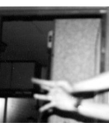
一見ギャグ「スマイル」(手の形に注目)