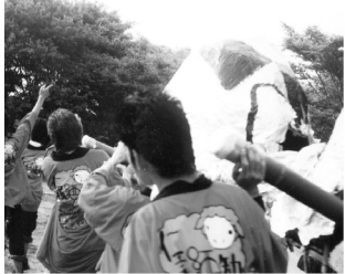
この日も、昨年度ではやどかり祭の実行委員会が行った安全対策を各団体から出すようにし、と本年度も実施された。

筑波大学の宿舎寮として開催されるやどかり祭。横濱市や香取市など、御前町にやどかり祭を運営する団体は今年で第二十七回を迎える。前回の御前町では暴行事件が発生し、その安全性や運営の問題を顕在化する結果となつた。今回のやどかり祭ではどのような安全対策が講じられたのだろうか。やどかり祭の安全性について検証した。