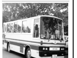
つくばセンターを中心に運行するのりのりバス