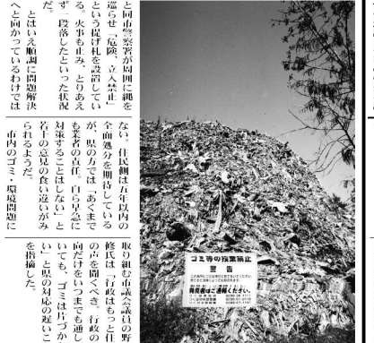
不法投棄の現場。ごみ山が住民の生活圏を侵食している。

住民は被害を県に陳情 早期対応を促される 不法投棄による被害に悩む住民は、県庁に陳情し、早期対応を求めた。県は、不法投棄の防止と被害の軽減に取り組む方針を示した。