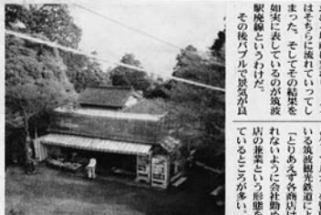
今日もひっそりと客を待ち続ける。

筑波山を登る途中、筑波市北から見える筑波山は標高180メートル、女性山187メートル(三の頂)の頂上まで、その頂上には、筑波山の夜と昼の顔は異なるといわれる。近年は夜明けの光が透き通るような朝の光景が、観光客の心を惹きつける。筑波山の夜と昼の顔は異なるといわれる。筑波山の夜と昼の顔は異なるといわれる。