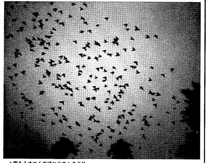
▲空をうめつくすばかりのムクドリ