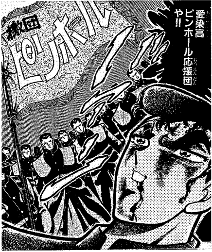
▲典型的応援団像(「男旗」石山東吉より抜粋)