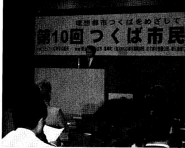
▲会議には藤沢市長も参加

つくば青年会議所主催の「第10回つくば市民会議」が9月23日に行われた。行政と市民団体の対話の場として、市民が行政について意見を述べ、行政側が市民の意見を聞き返すという趣旨で開かれた。市民会議は、つくば青年会議所が主催する。市民会議は、つくば青年会議所が主催する。市民会議は、つくば青年会議所が主催する。