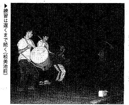
練習は遅くも続く(松美池田)