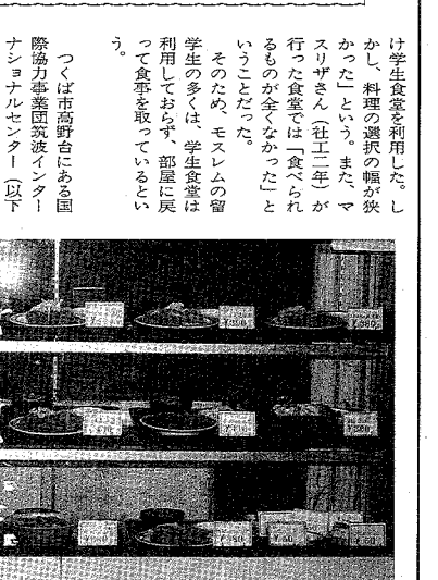
▲肉料理が多く並ぶ食堂