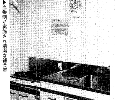
「つば」で感染する危険性も