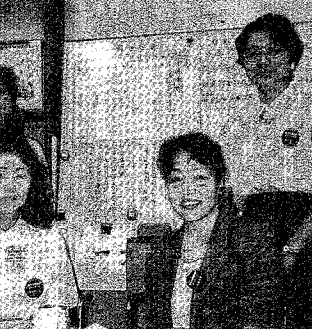
和やかな雰囲気の本館ボランティア

図書ボランティアは、月曜から金曜までの五日間、午前九時から午後五時までの間、カウンター・前のボランティア・カウンターで、TULIPSの使い方を指導している。ボランティアの人数は現在四十三人、筑波大とは直接関係のない一級生も含まれている。 「ここでは、活動後のボランティアに対する考えを聞いています。」(長谷部)