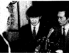
▲監視総監賞をうけたSさんと息子のC君