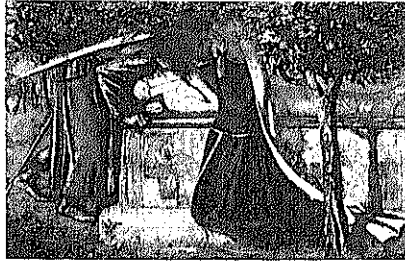
図1 Arthur's Tomb: the Last Meeting of Launcelot and Guenevere. 1855年 紙 水彩 23.5×37.8cm ロンドン, 大英博物館

が簡潔に記したこの場面を引き伸ばし、ランスロットとグィネヴィアの再会を、年老いて狂気を発するグィネヴィアにランスロットが失望をしめすことばからはじめている。