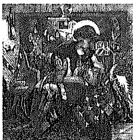
図2 The Wedding of St. George and the Princess Sabra. 1857年 紙 水彩 36.5×36.5cm ロンドン, テイト・ブリティッシュ

ウィリアム・モリスの影響下で自他の境界を明確化する力を《ブルズ》に描いたロセッティだったが、その制作年とおなじ1857年に聖ジョージがサブラ姫と結婚して部屋で抱擁しあう絵も描いている（《聖ジョージとサブラ妃の結婚》 The Wedding of St. George and the Princess Sabra , 水彩, S. 97, pl. 132, 図2）。この英雄の変化は、ホモソーシャルの領域からヘテロセクシャルな世界への移動をとまなう。部屋に入った英雄は、武具を外してリラックスする。ソネット「心の安息所」(“Heart’s Haven”)では、そのような「女の深い抱擁のなかに逃れる場所を求める」男の姿がうたわれる。