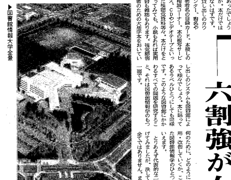
図書情報大学 六割強が女子