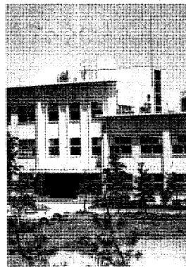
茨城大学 歴史ある大学 活発な自主活動