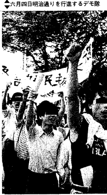
◆六月四日明治通りを行進するデモ隊