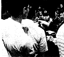
▼中国大使館付近で警官ともあう留学生たち

【筑波通信】「行動の波」が、筑波大学に波及している。中国民主化を訴える留学生の行動が、筑波大学に波及している。中国民主化を訴える留学生の行動が、筑波大学に波及している。中国民主化を訴える留学生の行動が、筑波大学に波及している。