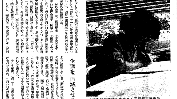
▲学園祭の準備をすすめる学園祭実行委員会(写真は本文と関係ありません)

全代会は、78年度の学園祭の準備をすすめる学園祭実行委員会に対して、大学の決定を覆えせぬことを求めた。全代会は、78年度の学園祭の準備をすすめる学園祭実行委員会に対して、大学の決定を覆えせぬことを求めた。