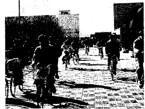
急ぎの自転車通学者で群を分ける学生たち

ウノ という雑誌は、学生たちの生活や学業に関する様々な情報を提供しています。その中でも、ホントの話というコーナーは、学生たちの生活や学業に関する様々な情報を提供しています。その中でも、ホントの話というコーナーは、学生たちの生活や学業に関する様々な情報を提供しています。 ホントの話 ホントの話というコーナーは、学生たちの生活や学業に関する様々な情報を提供しています。その中でも、ホントの話というコーナーは、学生たちの生活や学業に関する様々な情報を提供しています。その中でも、ホントの話というコーナーは、学生たちの生活や学業に関する様々な情報を提供しています。