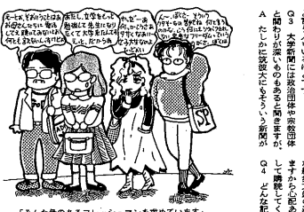
「そんな脅のあるフレッシュマンを求めています」

Q 筑波学生新聞の編集方針について教えてください。 A 自由な編集方針を堅持し、批判精神を堅持しています。学生たちの生活や学業に関する様々な情報を提供し、学生たちの声を代弁しています。 Q 筑波学生新聞の歴史について教えてください。 A 筑波学生新聞は、昭和25年に創刊された歴史があります。長年にわたって、学生たちの生活や学業に関する様々な情報を提供し、学生たちの声を代弁してきました。 Q 筑波学生新聞の役割について教えてください。 A 筑波学生新聞は、学生たちの生活や学業に関する様々な情報を提供し、学生たちの声を代弁する役割を果たしています。