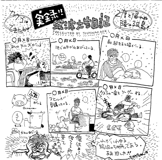
イラスト/青木俊直

おおきとしたお氏 筑波大基礎工学部'83年卒。現在、三菱電機にエンジニアとして勤めるが、まんがを描き続けている。昨年雑誌より『なすのちやわんやき』という単行本でまんが家としてデビュー。在学中は現代視覚文化研究会に所属し、仲間四人と同人誌『U.S.H.I』を発行。コミックマーケットで大好評を博した。