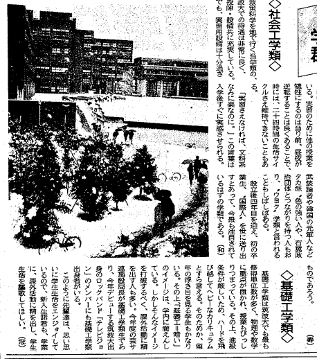
筑波大学学生新聞

工学の基礎となる学問である。近年は、国際化が進む中で、その重要性が認識されている。基礎工学類は、そのための基礎となる学問である。