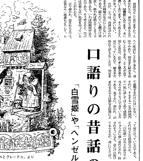
「ヘンゼルとグレーテル」より

口語りの昔話の原理とは 「白雪姫」や「ヘンゼルとグレーテル」 小澤俊夫 昔話の原理とは何か。それは、昔話の構造や内容、そして語り手と聞き手の関係性にある。昔話は、語り手によって語り出され、聞き手によって受け取られる。この関係性が、昔話の魅力を決定する。昔話の原理とは、この関係性を理解することである。 昔話の原理とは何か。それは、昔話の構造や内容、そして語り手と聞き手の関係性にある。昔話は、語り手によって語り出され、聞き手によって受け取られる。この関係性が、昔話の魅力を決定する。昔話の原理とは、この関係性を理解することである。