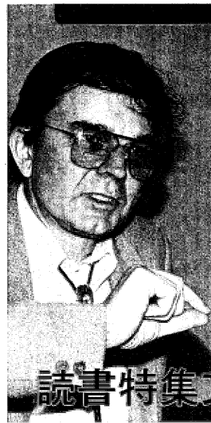
ロバート・クーバー