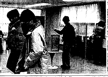
選挙違反が露呈 選挙違反が露呈 選挙違反が露呈