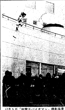
12月5日「超電子ハイオマン」撮影風景(つくばセンタービル)