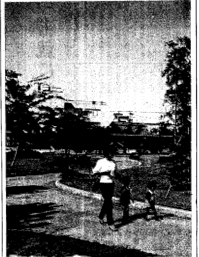
母親の仕事へ 「母親の仕事」の特集は、筑波大学に在籍する学生記者が、母親の生活、仕事、子育ての現状を取材し、その実態を明らかにしようとするものである。

「家から脱出したいとも考えない母親」は、母親の生活、仕事、子育ての現状を取材し、その実態を明らかにしようとするものである。この特集は、母親の生活、仕事、子育ての現状を取材し、その実態を明らかにしようとするものである。