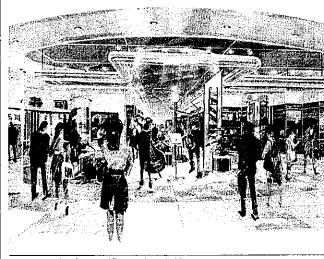
センタービルが完成

ベル人(ベルギー人)の学生が、学内での不適切な行為を行ったため、訓告処分を受けた。関係自治体は、ベル人の学生に対して、学内での行動規範を厳格に指導している。ベル人の学生は、処分を受け、反省を述べている。関係自治体は、ベル人の学生の行動を監視し、再発防止を図っている。