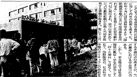
79学際院・本部楼へ向う学生

筑波大学は、今年度から、従来の「学年制」から「単位制」へと大きく変革した。この変革は、従来の「学年制」に比べて、学生の進級スピードが速くなること、また、学生が自分の興味のある分野に専攻できることなどが、大きな特徴である。 この変革は、従来の「学年制」に比べて、学生の進級スピードが速くなること、また、学生が自分の興味のある分野に専攻できることなどが、大きな特徴である。