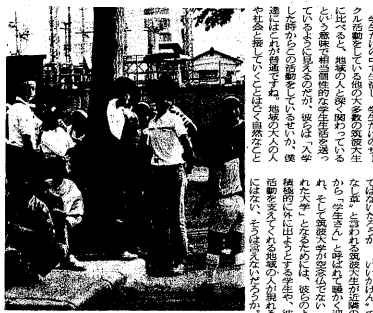
土浦市の子供たちと遊ぶかごぐらま

筑波大学の存在が、地域にどのような影響を与えているのか。その糸口となったのは、学生サークルの活動である。サークル活動を通じて、学生は地域と密着した関係を築き、地域貢献に努めている。 筑波大学の存在が、地域にどのような影響を与えているのか。その糸口となったのは、学生サークルの活動である。サークル活動を通じて、学生は地域と密着した関係を築き、地域貢献に努めている。