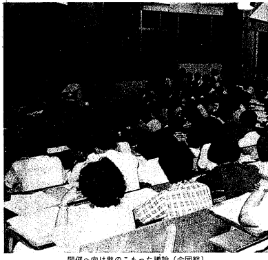
関係者への説明の様子(学生会本部)

【十八日(土)筑波大学学生新聞会(以下、学生会)本部発表】 学生会は、暴行の疑いで発議された事件について、大学に事実確認を急ぐよう求めた。学生会は、暴行の疑いで発議された事件について、大学に事実確認を急ぐよう求めた。