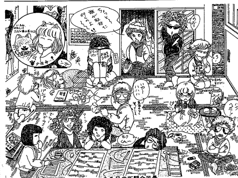
ある日の新聞風景