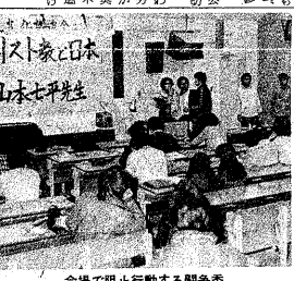
会場で阻止行動する闘争委