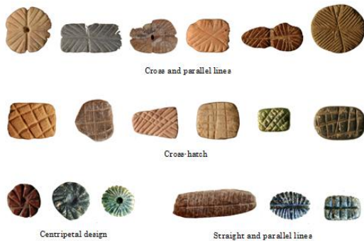
ケルクに見られる主要な 4 つの印章押捺面のデザイン

価できるものであり、歴史的にも極めて重要な意味を有している。テル・エル・ケルクからは 100 数十点にのぼる石製・骨製・土製の印章と、6 点の印章が押捺された未焼成の土の印影が出土しており、当時の社会では封泥システムは極めて一般的であった。それは、私たち日本人にとって日常生活の財産管理や物資の交換の証明に不可欠な印鑑とほぼ同様の意味を有していたのである。印章の分類と他の遺跡から出土している印章類との比較研究から、封泥システムからみるとケルクの社会には少なくとも 5 つ以上の物資管理グループが存在したと推定された。