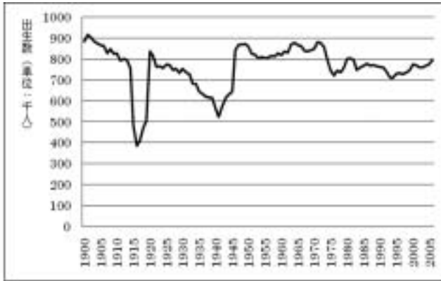
(図-3) フランスにおける出生数の推移