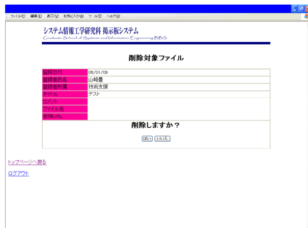
図6. 掲示板削除画面

掲示板の削除は、その連絡事項の登録人と登録人と同じ系の担当者のみが削除できる。 掲示板削除の画面を図6に示す。