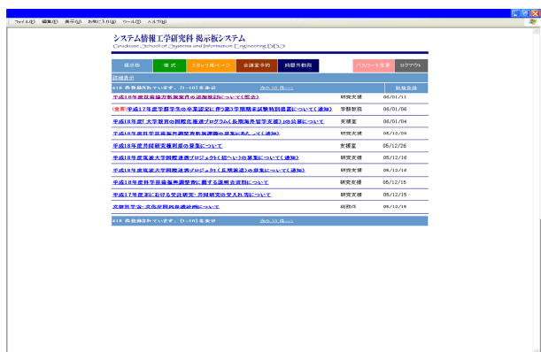
図3. 連絡事項リスト表示画面

画面には連絡事項が5件ずつ表示されるようになっている。 連絡事項のリスト表示画面を図3示す。