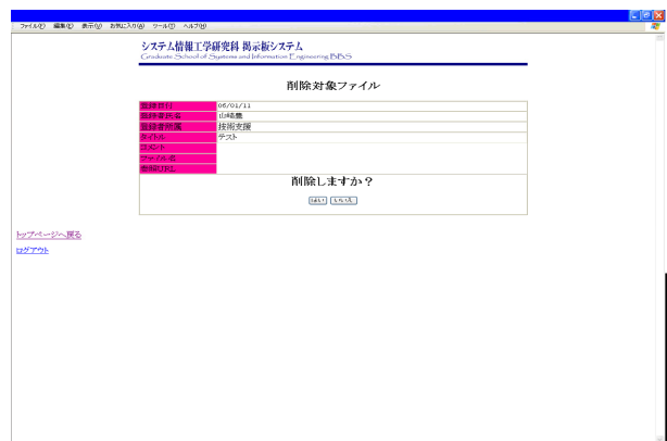
図 10. 様式削除画面

様式の削除は、その様式の登録人とその登録人と同じ係の担当者のみが削除できる。 様式削除の画面を図 10 に示す。