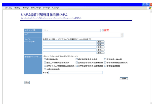
図4. 掲示板登録画面

掲示板システムに連絡事項を登録できるのは、システム情報等支援室の各系の登録を許可された担当者のみである。 掲示板登録の画面を図4に示す。