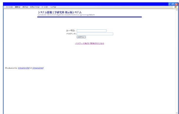
図1. 掲示板システム ログイン画面

はじめに掲示板システムについて説明する。掲示板システムを利用できるのは、システム情報工学研究科、第三学群およびシステム情報工学等支援室の所属であらかじめ掲示板システムにユーザ登録された構成員のみである。掲示板システムのログイン画面を図1に示す。