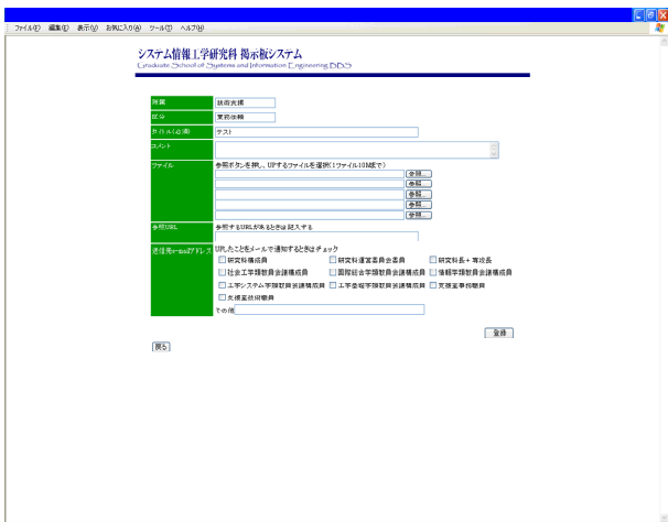
図 8. 様式登録画面

様式システムに様式を登録できるのは、システム情報等支援室の各係の登録を許可された担当のみである。 様式登録の画面を図 8 に示す。