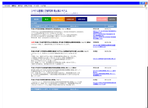
図2. 連絡事項詳細表示画面

掲示板システムを構築するためのコンピュータシステムとしては、Webアプリケーションでは利用者の多い構成で、オペレーティングシステムはLinux、WebサーバソフトウェアはApache、サーバサイドアプリケーションはPHP、データベースアプリケーションはMySQLで構築した。また、システム全体をSSLのセキュリティ環境で構築してある。