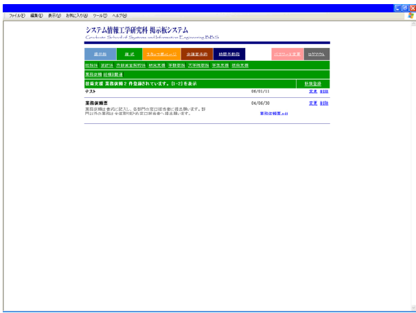
図 7. 様式閲覧システム画面