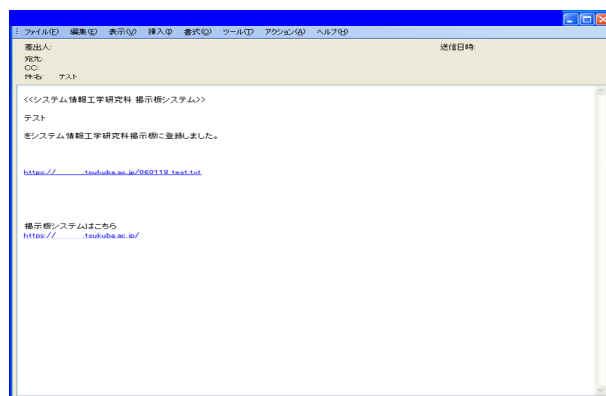
図5. 送付メール画面

掲示板登録を行うと同時にその連絡事項の関係部署の構成員に連絡事項が登録された旨のメールを送付することができる。そして、この送付されたメールの本文内のリンクを選択することで掲示板システムにWebからアクセスしなくても直接連絡事項の本文を確認できる機能を備えているのが大きな特徴である。 送付されるメールの画面を図5に示す。