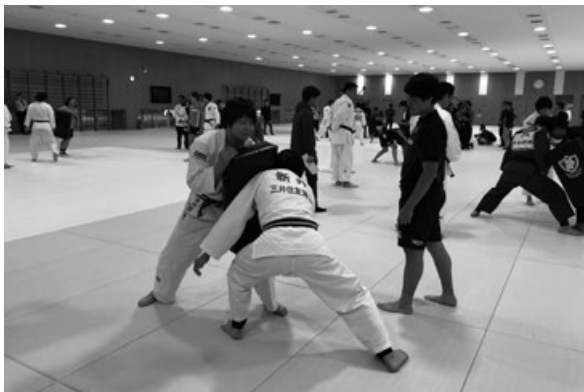
写真3 ラグビーナショナルチームとの練習風景

4月の最終選考会が終わってから大会までの約6ヶ月間、国内外合わせて7回の合宿を実施した。2018年1月から一部ルールが変更され、合せ技「一本」(合わせ技とは「技あり」2つのこと)が昨年の廃止から一転して復活となり、これをどう試合に活かしていくか最大の課題として合宿で取り組んだ。具体的には、2017年1月に「技あり」と「有効」が「技あり」に統一され、それまでの「有効」レベルの技も「技あり」となったものの、昨年までは3つも4つも「技あり」を奪ったとしても「一本」を取らない限り試合は終わらなかった。しかし今回のルール改正により「有効」レベルの技を2つ獲得するだけで「一本」になってしまうことから、ディフェンス面の強化をポイントの一つとして取り組んだ。攻撃面に関しては、確実に「一本」を獲得できるよう立技から寝技への移行を昨年に引き続き強化を図った。また、ゴールデンスコア(延長戦)における勝敗決定方法がスコア(「技あり」か「一本」)または「反則負け」(直接的または「指導」の累積による)になり、試合時間の長時間化が予想された。そこで持久力向上を目的に女子ラグビー日本代表との合同トレーニングを行い、柔道のトレーニング方法にはない体力強化方法を学ぶことも取り入れた。