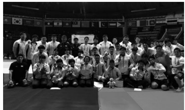
写真4 アジア大会集合写真