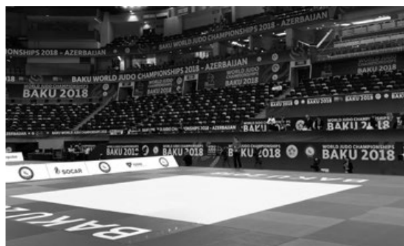
写真 2 世界選手権試合会場