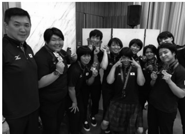
写真5 世界選手権女子メダリストを囲んで

勝ち上がったことも非常に大きかった。そして、何よりも世界選手権に臨む選手たちの心技体の充実さが、素晴らしいパフォーマンスにつながったといえる。