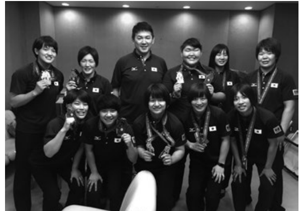
写真2 女子メダリストを囲んで

の中国人選手にあと一步のところまで敗退し、銀メダルを獲得した。大会七日目、21カ国が参戦した男女混合団体戦は、日本は総合力で優り初代王者に輝いた。今大会女子の結果は個人戦において金メダル3個、銀メダル4個、銅メダル1個、男女混合の団体戦において金メダルを獲得した。個人戦に出場した6階級全てにおいて決勝に進出を果たし、9名中8名がメダルを獲得するなど2020年の東京オリンピックに向け良いスタートを切ることができた。