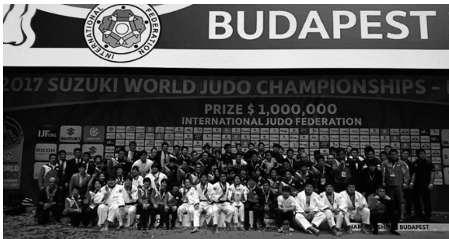
写真3 全日本チーム集合写真

2017年1月から施行された新ルールについて、本戦の4分間では「指導」の数だけでは勝敗が決しないという点が今回日本にとって有利に働いた。これまで外国人のパワフルな組手に対して、試合の前半に「指導」を与えられ、ポイントを取り返すことができず「指導」差で敗れるケースが見られた。しかし、新ルールの元では「指導」を与えられても本戦では勝敗が決しないため、選手たちも慌てることなく、技を出すことだけに集中することができたの