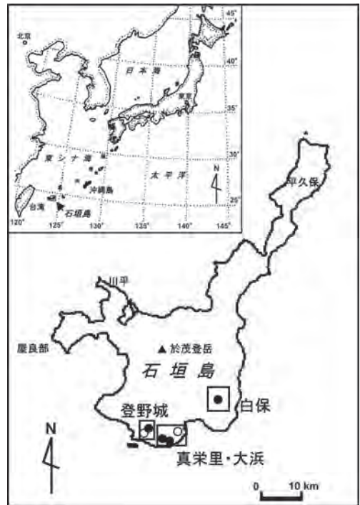
第 1 図 石垣島の位置と津波石の分布 (○印は台座をもつ津波石、●印は台座をもたない津波石を示す)

石垣島周辺には過去数千年間において、数回の大津波が襲来した（河名・中田，1994）。有史以来で最も大きな津波の 1 つは 1771 年の明和津波で、約 12,000 人の犠牲者を出し未曾有の災害をもたらした。津波によりサンゴ礁の礁縁（リーフエッジ）が破壊され、それが打ち上げられて定置した津波石の場合は、それに含まれるサンゴ化石の中で最も新しい年代を津波の発生した時期と考えることができる。河名・中田（1994）は、宮古諸島から石垣島など八重山諸島全域における総計 65 個の津波石の ^{14}\text{C} 年代値（未較正值）に基づき、1771 年明和津波以前の大津波の時期を、約 500 年前、約 600 年前、約 1100 年前、約 2000 年前、約 2400 年前、約 3750 年前、約 4350 年前および