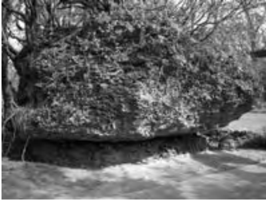
第2図 末吉神社の鳥居脇の巨礫と台座岩：台座岩の高さが地表面低下量（石灰岩溶解量）を示すと考えられる

どであった。前述した石灰岩の台座岩の例では、その上に載る岩石は溶解し難い岩質からなる迷子石であることが多い。しかし、喜界島のこのケースは、台座岩およびそれを保護している帽岩（cap rock）ともに溶解しやすい石灰岩から構成されるという特徴をもつ。台座岩周辺の地表には厚さ数cmの砂層があり、その下は台座岩と同じ岩相をもつ石灰岩の基盤となっている。