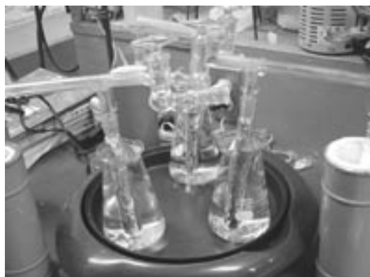
第2図 真空蒸留装置の概観

土壌および植物体中の水を入れ替えるため、同位体組成既知の水 (一般水道水) を大量に散水し、重力排水させた後、数日放置する、というプロセスを 1 ~ 2 週間程度繰り返し行った。この際、水道水の同位体組成が日毎に変化する影響を除くため、実験開始時に十分な量の水を密閉ポリ