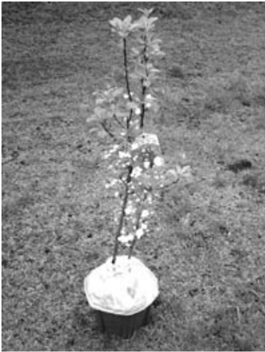
第3図 実験に用いたポット植栽のヒメリンゴ

タンクに汲み置きして用いた。また、蒸発による土壌水の同位体濃縮が生じないように、土壌表面をビニールで被覆した(第3図)。