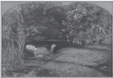
図3 ジョン・エヴァレット・ミレイ 《オフィーリア》1852年 油彩・カンヴァス、76.2×111.8 cm、テイト