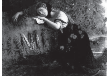
図6 ジョゼフ・セヴァーン 《オフィーリア》1831年、109×140 cm 油彩・カンヴァス、個人蔵