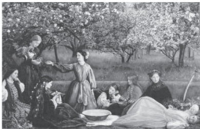
図8 ジョン・エヴァレット・ミレイ 《林檎の花》1856-1859年 油彩・カンヴァス、110.5 × 172.7 cm レディ・リーヴァー・アート・ギャラリー