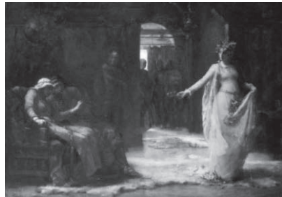
図5 ヘンリエッタ・リー 《オフィーリア》1890年 油彩・カンヴァス、171.5×230.5 cm ウォーカー・アート・ギャラリー