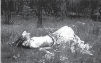
図7 ジョン・ウィリアム・ウォーターハウス 《オフィーリア》1889年 油彩・カンヴァス、98×158 cm、個人蔵