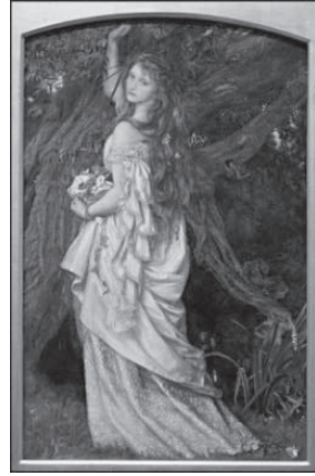
図2 アーサー・ヒューズ 《オフィーリア》 1865年頃、油彩・カンヴァス、 94.8×58.9 cm、トレド美術館