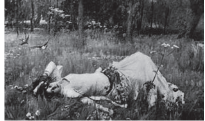
図9 ジョン・ウィリアム・ウォーターハウス 《オフィーリア》(1889年) 加筆前の写真