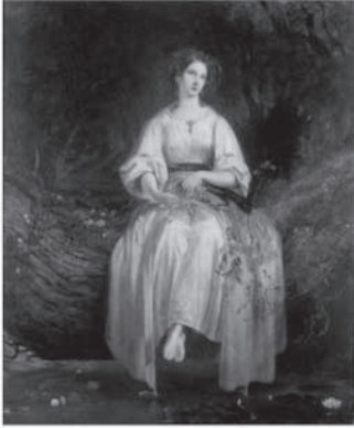
図1 リチャード・レッドグレイヴ 《花輪を編むオフィーリア》 1842年、油彩・板、76.2×63.5 cm ヴィクトリア・アンド・アルバート美術