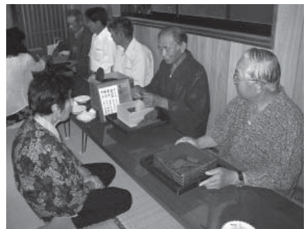
写真3 「お札引き」(生月島元触)

小組の御神体であるお札は、小さな木札15枚と1枚の親札の計16枚が基本セットで、15枚の札の表と裏にマリアの生涯を語った「ロザリオの(十五)玄義」に対応した記号と、同じ内容のオラショ「十五くだり」の文句が記されている。そのため本来はロザリオの祈りに関連して用いた聖具だと思われる。またこの組の別称である「コンパニヤ」は、イエズス会の信仰組織の名称であるコンパニアに通じることから、イエズス会が設けた一般信者を対象とした組だと想像できる。