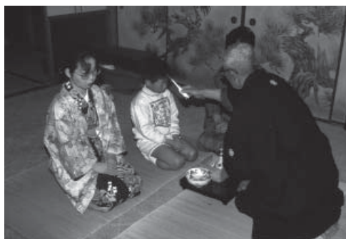
写真2 「お授け」を行う御爺役（生月島）

生月島の在方集落では信仰指導やお授け（洗礼）を行う役職を「御爺役（おじいやく）」と呼ぶが、これは「慈悲役」の転化と思われる。また根獅子の組では御爺役に相当する役職を「水の役」と呼