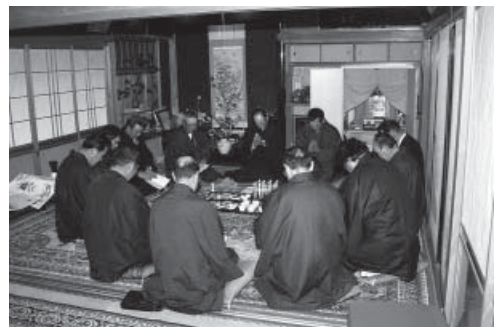
写真1 山田の三触寄り「ハッタイ様」行事

山田集落は山田・日草・正和の3つの「触」という地区に分かれるが、触単位で「お授け」（洗礼）を行う「御爺役」という任期制の役職が各1名いた。山田集落では、御爺役が中心となっていく「三触寄り」という行事が年数回行われたが、そのうち「風止めの願立て」「風止めの願成就」では、中江ノ島に渡って聖水を採取した。