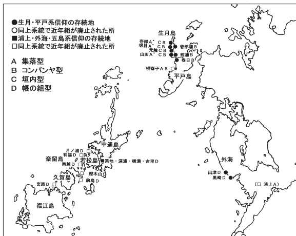
図2 長崎県下のかくれの組のタイプ別分布

かくれ信仰に伴う様々な形態の組は、戦国～江戸時代初期に展開したキリシタンの組に起源が求められることについて簡略に述べた。禁教時代の記録が皆無に近い場合、信仰のあり方を連続的に捉えられない部分はあるものの、その前後の