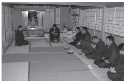
写真4 垣内の行事（元触小場「野立ち」） 座敷奥に聖母子のお掛け絵が祀られている。

マリア、諸聖人の姿などを描いた聖画は布教初期から確認できるが、当初は舶来の貴重品で、飾られる場所も教会や、領主など有力者の家に限られていた。しかし 1583 年に画技に秀でたイエズス会修道士ニコラオが来日し、1591 年以降、島原・天草地方や長崎の工房で聖画が大量に制作されるようになったことで [坂本 1999]、聖画が各地の信者に配布され、キリスト、聖母、諸聖人など特定の対象を信心する信心組の成立を促したと考えられる。生月島でもこうした流れの中で信心組が多数結成されたと考えられるが、その際に以前から存在した小組を下部組織に取り込んだと思われる。その後生月島では早い時期（1599 年）に禁教時代に入り、教会の破却とともに慈悲の組の機能は低下したが、信心組がそれに代わる信仰継承の母体となっていったことが想定される。