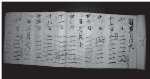
写真5 御帳(五島奈留島)

外海地方と、18世紀末以降外海からの移住が行われた五島地方に広く分布したこのタイプの組は、帳方—水方—間役というシンプルな役職形態と、日繰暦を信仰の中心とする点が特徴である。この組と類似する組織については、京都周辺の状況を記した次の記述がある。