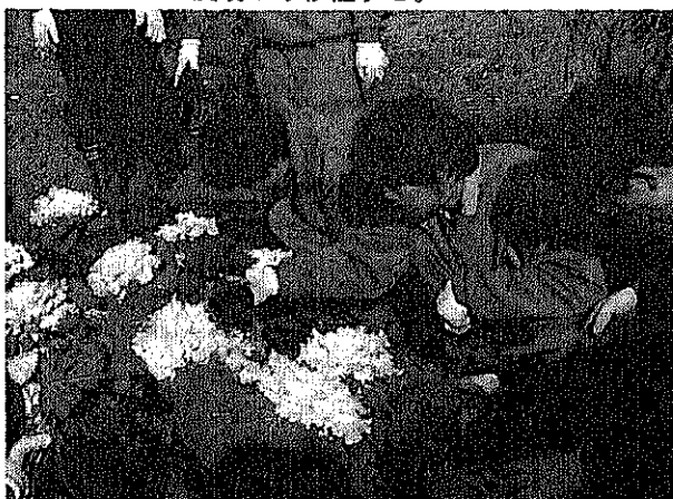
画像1 葉ボタンの植え替え