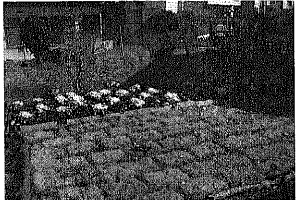
画像3 クラインガルテン全景

を体験して、植物はいつもよりも冬に弱いことがわかった。特に雪！ 今度また学校に作るとしたら、学校は全体的に地味な色が多いと思うのでもっと多くの色を入れたい。」「前の家や道路から見える印象が大分変わったと思う。以前は荒れ果てていた所が花や草で色がついてとてもきれいになったので良かった。」「裏門からのすぐく目立つ場所が暗かったのが少し明るくなって、入ってくる時の印象が良い意味で変わったと思った。」このように、クラインガルテンの制作を通じて、生徒は身近な生活環境を改善することが課題であることに気がつき、積極的に関わる方法を学びとることができたと考える。