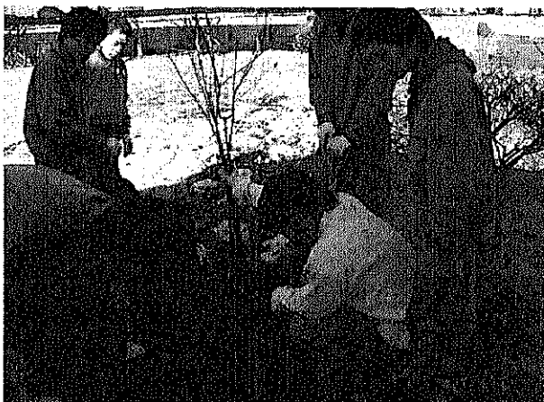
画像2 ザクロの移植