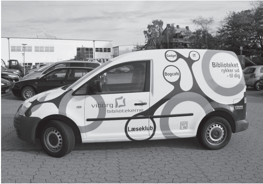
写真1. 「図書館があなたのところに！」と描かれたワゴン車型端末、スマートフォンなどを積みこんでリクエストを受けた高齢者施設や学校を訪問する新たなアウトリーチサービスである。訪問先では機器の講習会やデジタル機器を使ったワークショップを開催したり、さらには電子書籍端末を使った読書会やブックカフェの立ち上げにも関わる。デンマークでも図書館は資料を貸し出すところというイメージが強く、図書館が資料提供以外の多様なサービスを行っていることは意外に知られていない。このサービスはITサポートに関して実質的な効果をあげただけなく、司書が利用者とのコミュニケーションの密度を高めることで、利用者への図書館に対する認識を変える結果となったことが報告されている。