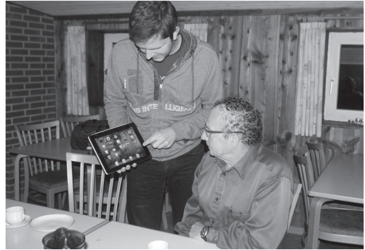
写真2. 図書館職員がIT機器の使い方をマンツーマンで教える能は明示されていないが、このモデルが情報・資料と利用者をつなぐ図書館の中核的機能を基盤として成立していることはいうまでもない。

1970年代から1980年代にかけてデンマークの公共図書館は静寂の場から利用者同士が会話を交わす空間となり、現在では図書館が静かな空間だと思っている利用者はほとんどいない。Jochumsenらは自由度の高いデンマーク公共図書館のあり方をインスピレーションの空間、学びの空間、出会いの空間、創作空間からなる四空間モデルとして提示している。インスピレーション空間は多様なメディアを通じて文化的刺激を受け取る場、学びの空間は情報と知識への自由なアクセスを通してエンパワーメントを実現する場、出会いの空間は図書館を通して他者と関わり合い社会的参加を可能にする場、創作空間は創造のためのパフォーマンス・スペースである。四空間モデルをシンプルにして、四空間を図書館内に創り出す司書を要素として付加したのが図1である 2) 。四空間モデルには資料の保存・提供などの公共図書館の基本機