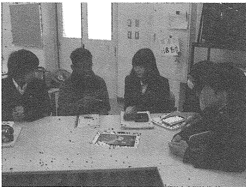
グループでのディスカッション活動の様子② (本校訪問中のインドネシア生徒と)