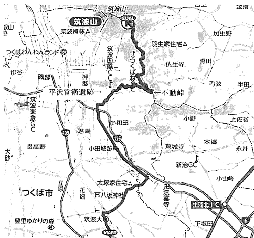
図1 MTBグループ走コース詳細