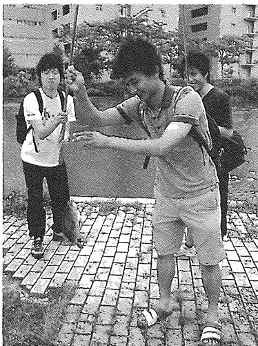
写真3 班別活動(釣り)の様子

ルーギルなど計8匹を釣り上げていた。また別の班は大学周辺の久松農園へブルーベリー狩りに行き、そこで採ってきたブルーベリーでジャムを作成したり、ダッチオーブンを用いてパンを焼いたり、草木を用いて染物を行う等、各班の興味関心に沿って多彩な活動に取り組んでいた。15時までにグループ別活動を終え、その後グループ活動の報告会を行い、班ごとに取り組んだ活動の内容や感想を発表した。報告会後は生選パーティーとして、パエリアやスタッフドチキン等のパーティー形式の野外料理メニューを作り、夕食後はキャンプファイヤーを行った。