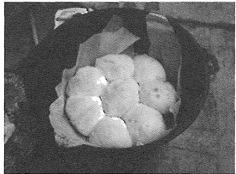
写真4 班別活動(パン作り)の様子