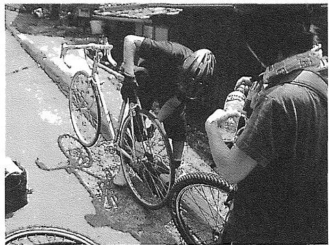
写真2 MTBグループ走の様子2