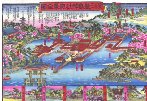
図2 日本三景之一巖島神社真景全図(明治37年)