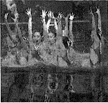
写真5 日本のフリールーティン演技