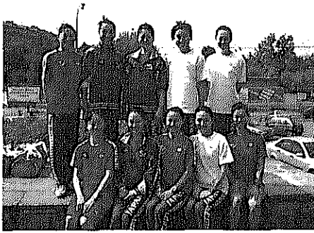
写真2 日本代表ジュニアチーム

今大会にはアジアから日本の他に、中国、カザフスタン、タイ、マレーシア、マカオ、ウズベキスタンの7カ国が出場し、アジア大陸からの過去最多出場国数を記録した。北朝鮮および韓国はエントリーしていたものの直前に参加を取り止め、非常に残念であった。今後アジア諸国のシンクロの普及・発展がますます活性化するようお願いしたい。