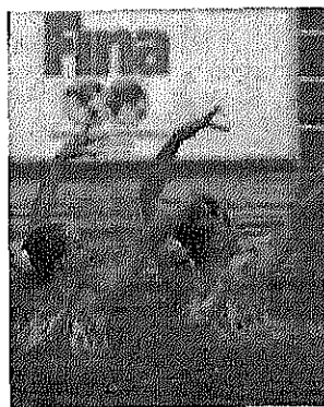
写真4 優勝したロシアのデュエット

得点に及ばず3位となった。優勝したロシアのデュエット（写真4）は最年少の1989年生まれであったこと、「白鳥の湖」のルーティンを泳いだことに驚かされた。「白鳥の湖」は2002年のワールドカップ優勝者のロシアのダビドワ・アナタスシア、エルマコワ・アナタスシア組が泳いだ演目で、その展開の速さと難度の高さは圧巻だった。その振り付けこそ若干ジュニア風にアレンジされていたようだが、シニア選手の最高峰の演目を最後まで泳ぎきるレベルの高さは見事だった。今後の成長が楽しみである。