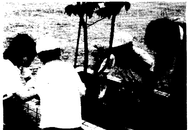
チャイルドガーデン作りを通した園児との交流

本校生徒も実習前には園での実習や園児との交流に不安を抱いていたようだが、チャイルド・ガーデン作りや動物たちとのふれあいを通して貴重な経験をすることができた。(安達)