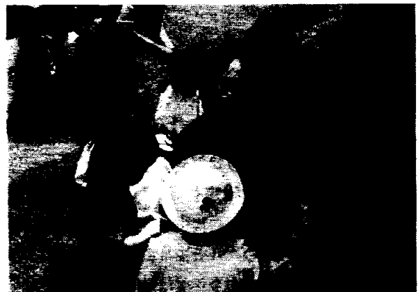
メダカの会の体験学習

5月15日(月)坂戸市未就学児童のサークルであるめだかの会(母子25組)が農場を利用し体験学習を行った。今年で10回目を数えるこの講座では、鶏卵の採卵体験や農業生物のふれあいや見学を通して、農業や自然、食の大切さについて親子で学ぶことを目的におこなわれている。(嶋田)