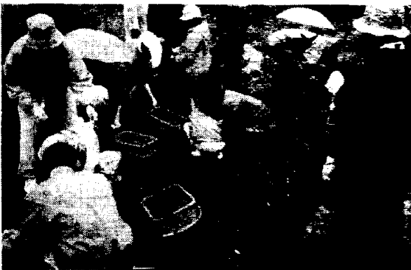
附属盲学校とのイモ掘り交流

わたしはこわかった。けどたのしかった。そしてかえるじかんになってしまいました。もっといたかったけどかえるじかんになった。わたしわあめだったからくるまにのせてもらいました。わたしは2だいにのりました。ぬれなくてすんでよかった。のせてくれてありがとーございます。