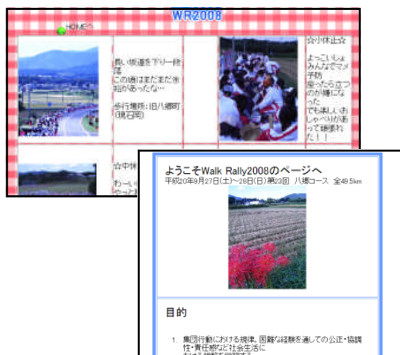
図2. 生徒が作成したWebページの例 (左上が1学年生徒作品、右下が2学年生徒作品)

勤務校の目玉行事の一つが、毎年9月末に行われるウォークラリー(歩く会)である。2日間かけて学校を目指して歩くこの行事は苦痛を伴う反面、生徒の中で忘れられない思い出となるようである。この行事を写真と文字で振り返るため、Webページ作成実習を取り入れている。