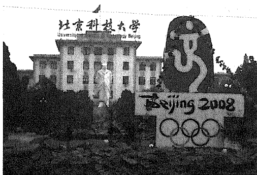
写真2 北京科技大学