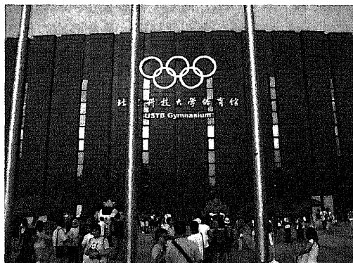
写真1 北京科技大学体育館

試合会場である北京科技大学（写真2）までは、ホテル近くのバスターミナルから無料のシャトルバスで約20分程度であった。筑波大学とまではいかないが、北京科技大学のキャンパスは広大で、正門から体育館まで約10分程度歩かなければならない。そして体育館の入口では厳しいセキュリティーチェックを受けて試合会場に入った。試合場は2試合場設置されており、場外が緑色で場内はクリーム色に近い黄色であった。（写