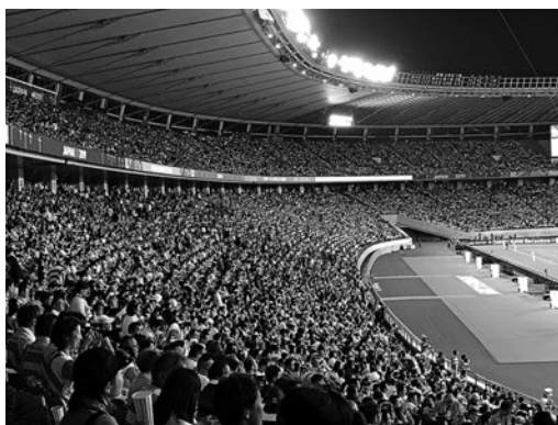
写真2 会場の雰囲気

いう話がされていた。世界で最も強く、魅力的なラグビーをするニュージーランドを盲目的に模倣する指導者に対して、警鐘を鳴らすような質問をされていたのが印象深かった。ニュージーランドに勝つためには、彼らを模倣するのではなく、イングランドの選手や風土にあった強みを最大化させて、考えるべきだといつも述べていた。結果として、4年間ニュージーランドに勝利を準備してきたイングランドがニュージーランドに勝利し、そのニュージーランドに予選リーグで完敗した南アフリカが、決勝でイングランドを抑え勝利した。南アフリカは決して華やかなラグビーをするわけではなかったが、スクラムやラインアウト、タックルというラグビーの根源的な部分の強みを最大限発揮して、同じような強みを持つイングランドを圧倒した。もし、ニュージーランドが決勝で南アフリカと対戦したら、どうなっただろうか。今大会、ニュージーランドを破ることができたのは、4年間ニュージーランドにどう勝つかを準備してきたイングランドだけだったのではないだろうか。指導者として、選手の能力を最大化させること、自チームを知って強みにこだわること、ピーキングなど多くのことをこの対戦から学ぶことができる。