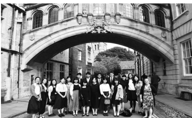
ため息の橋の前で

【本研修は日本学生支援機構（JASSO）と筑波大学海外留学支援事業（はばたけ！筑波大生）の両方の支援を受けており、記して感謝の意を表する。】