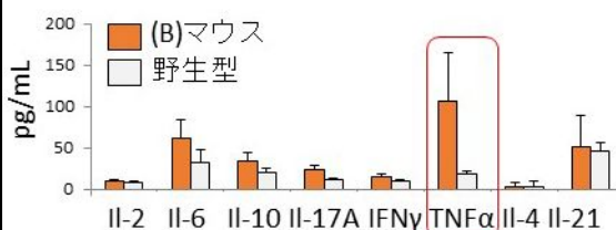
図2「支持環境細胞および腫瘍細胞における多系統変異モデル」マウスにおけるサイトカインプロファイル